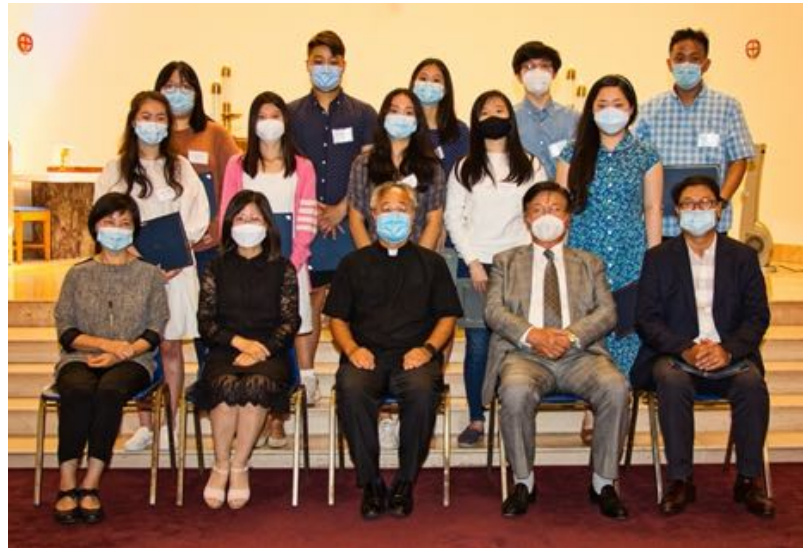
2020 St. Paul Chung Ha Sang Scholarship

Like the deer that yearns for running streams, so my soul is yearning for you, my God; my soul is thirsting for God, the living God.