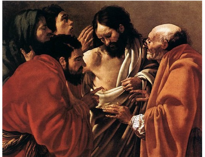
보지 않고 믿는 사람은 행복하다

네 손을 넣어 못 자국을 확인해 보아라. 의심을 버리고 믿어라. 알렐루야.