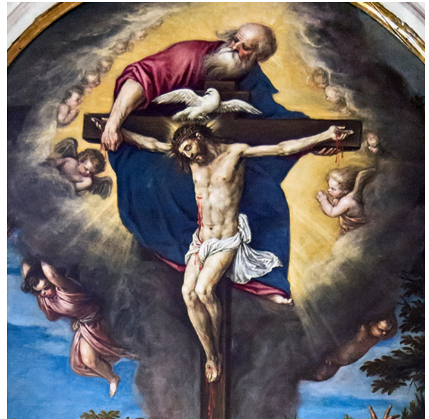
The LORD, the LORD, a merciful and gracious God

Since you are children of God, God has sent into your hearts the Spirit of his Son, the Spirit who cries out: Abba, Father.