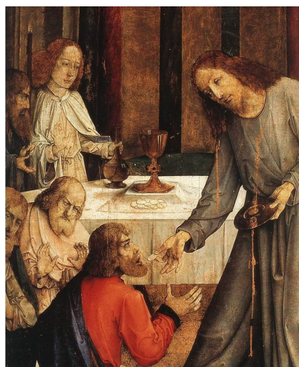
Whoever has my commandments and observes them is the one who loves me.

If you love me, keep my commandments, says the Lord, and I will ask the Father and he will send you another Paraclete, to abide with you for ever, alleluia.