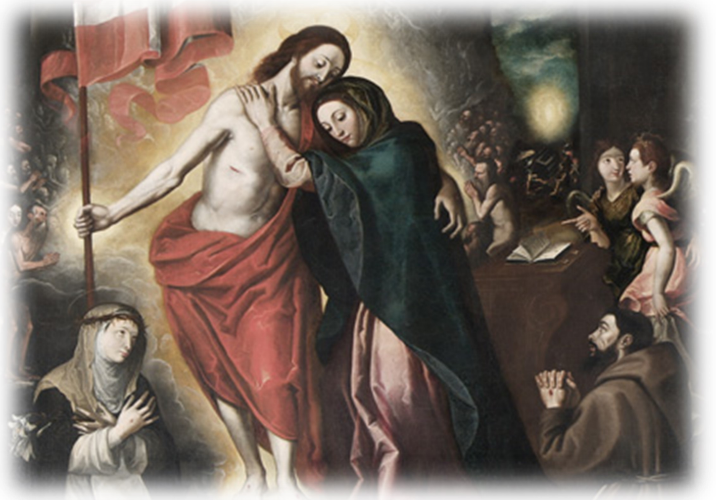
Risen Christ Appears to His Mother — by Daniele Monteleone, 1600