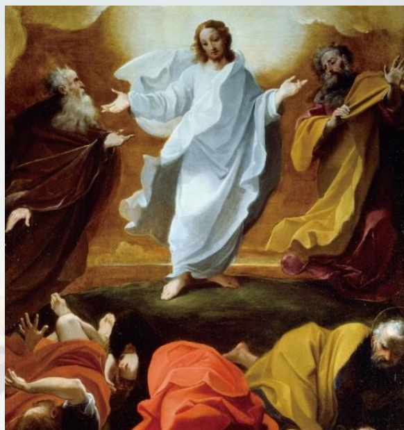
This is my beloved Son, with whom I am well pleased

This is my beloved Son, with whom I am well pleased; listen to him.