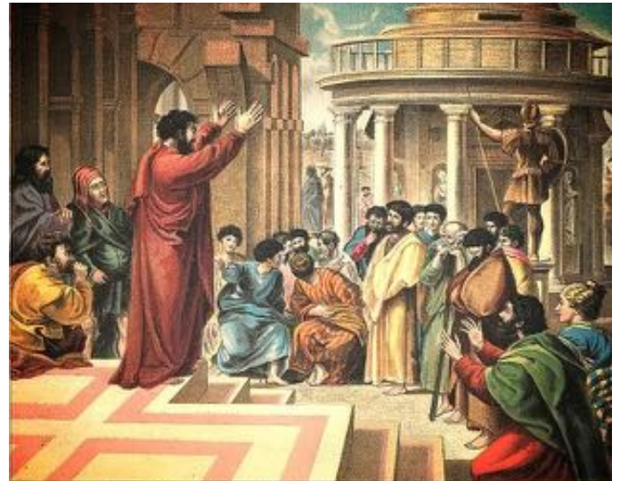
Paul Preaching at Athens Painting by Raphael