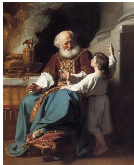
"Speak, for your servant is listening."

You have prepared a table before me, and how precious is the chalice that quenches my thirst.